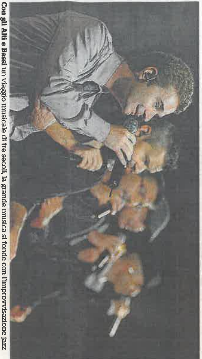
Con gli Alti e Bassi un viaggio musicale di tre secoli, la grande musica si fonde con l'improvvisazione jazz