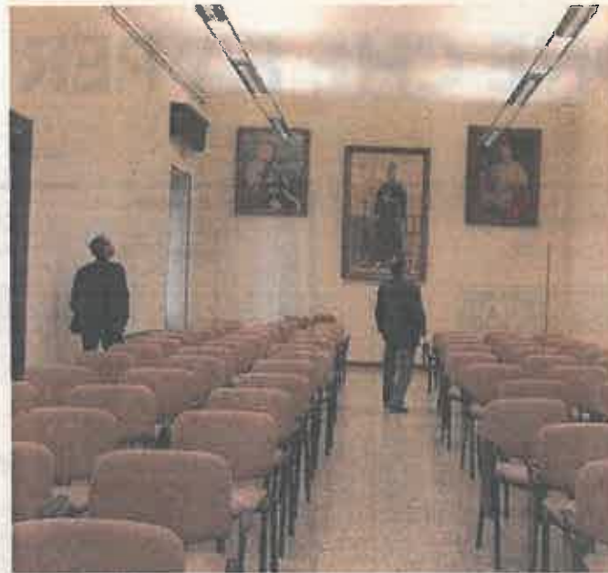
La sala convegni annessa al Museo, ospitato nell'ex Seminario

Un gruppo di opere, inoltre, fa parte delle collezioni civiche: confluite in tempi differenti nei depositi comunali provenienti da enti ecclesiastici soppressi, non sono mai state esposte e ora trovano una loro collocazione in virtù di una convenzione sottoscritta tra la Diocesi e l'ammini-