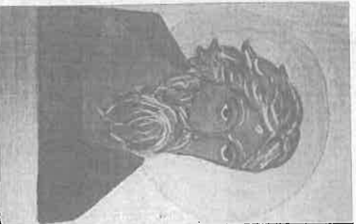
TORTONA - La Diocesi di Tortona propone, per la durata dell'evento "Conoscere per Trasmettere", dei laboratori didattici, rivolti

Le fonti a confronto. Oltre ai ricchi arredi e ai preziosi oggetti che ci sono rimasti della storica chiesa di Santa Maria di Loreto, oggi conservati presso la sala a lei dedicata all'interno del Museo Diocesano, molti sono i documenti d'archivio che ci parlano dell'importante confraternita che vi aveva sede e che ebbe un ruolo rilevante nella storia della comunità religiosa tortonese. Seguiti dall'archivista i ragazzi potranno simulare una ricerca storica: partendo dall'inventario potranno vedere alcune preziose pergamene e consultare i documenti conservati nell'Archivio Storico Diocesano. Durata complessiva della visita e laboratorio 2 ore. Consigliato per le classi della scuola secondaria di primo e secondo grado.