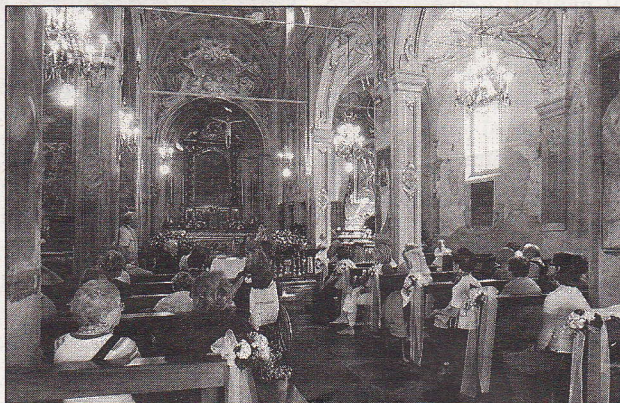
Dall'alto alcuni dei vari momenti di valorizzazione del patrimonio artistico della diocesi proposti nell'ultimo fine settimana