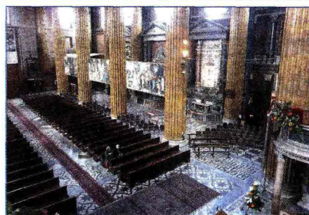
La navata di destra della Cattedrale dove si aprirà il nuovo cantiere di restauri, al centro un particolare eloquente dello stato delle volte e, a destra l'interno del Duomo, transennato da gesso nelle navate laterali